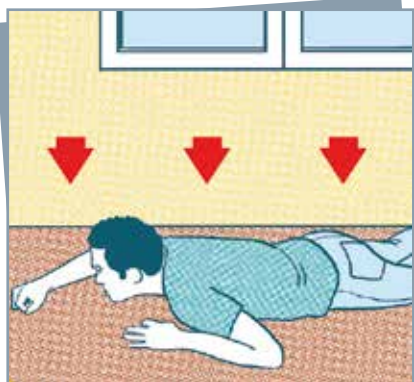
S'allonger au sol