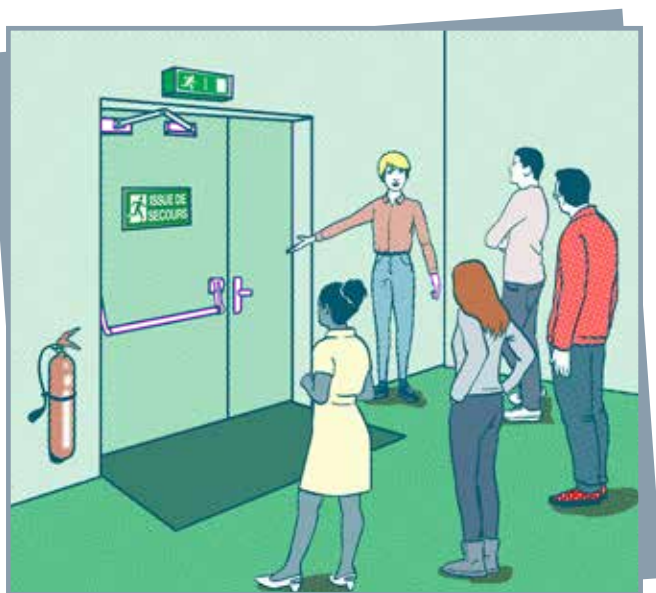
Connaissance du site

Il est conseillé d'organiser un exercice annuel intrusion/attentat en s'inspirant des consignes ou instructions du ministère de l'éducation nationale. A cet effet, un fascicule, destiné en priorité aux mineurs les plus jeunes est joint en annexe au présent guide.