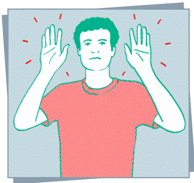
Mains levées et visibles