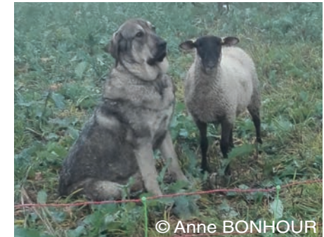
Cão de Gado Transmontano