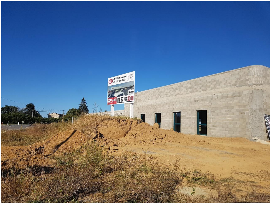
Figure 1 : Photo 1 : vue depuis la sortie du rond-point