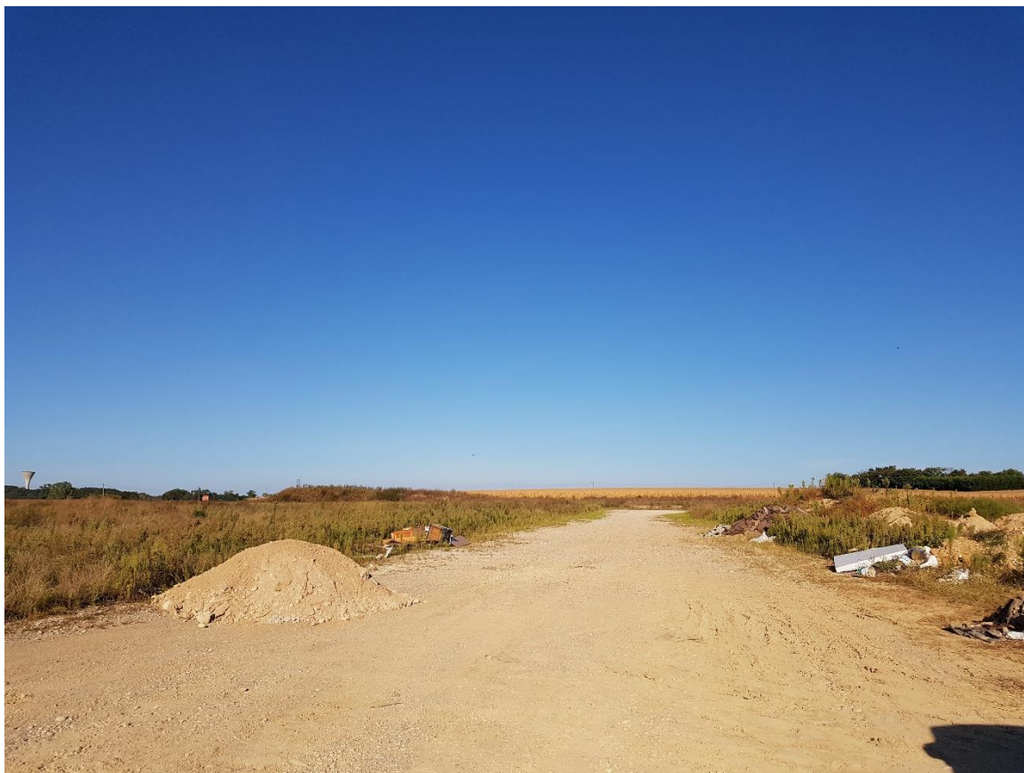
Figure 7 : Photo 7 : Vue du site depuis le nord