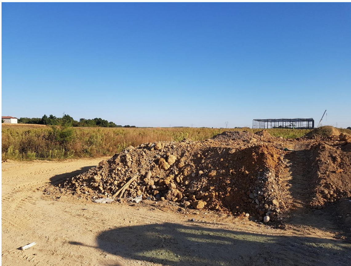
Figure 5 : Photo 5 : Vue depuis le centre du site vers le nord