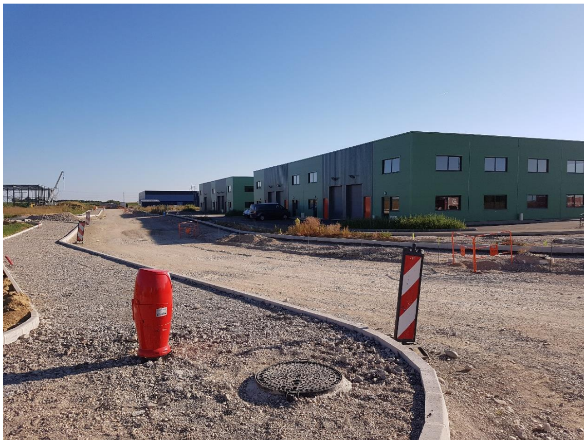
Figure 3 : Photo 3 : Vue du site depuis sa façade est