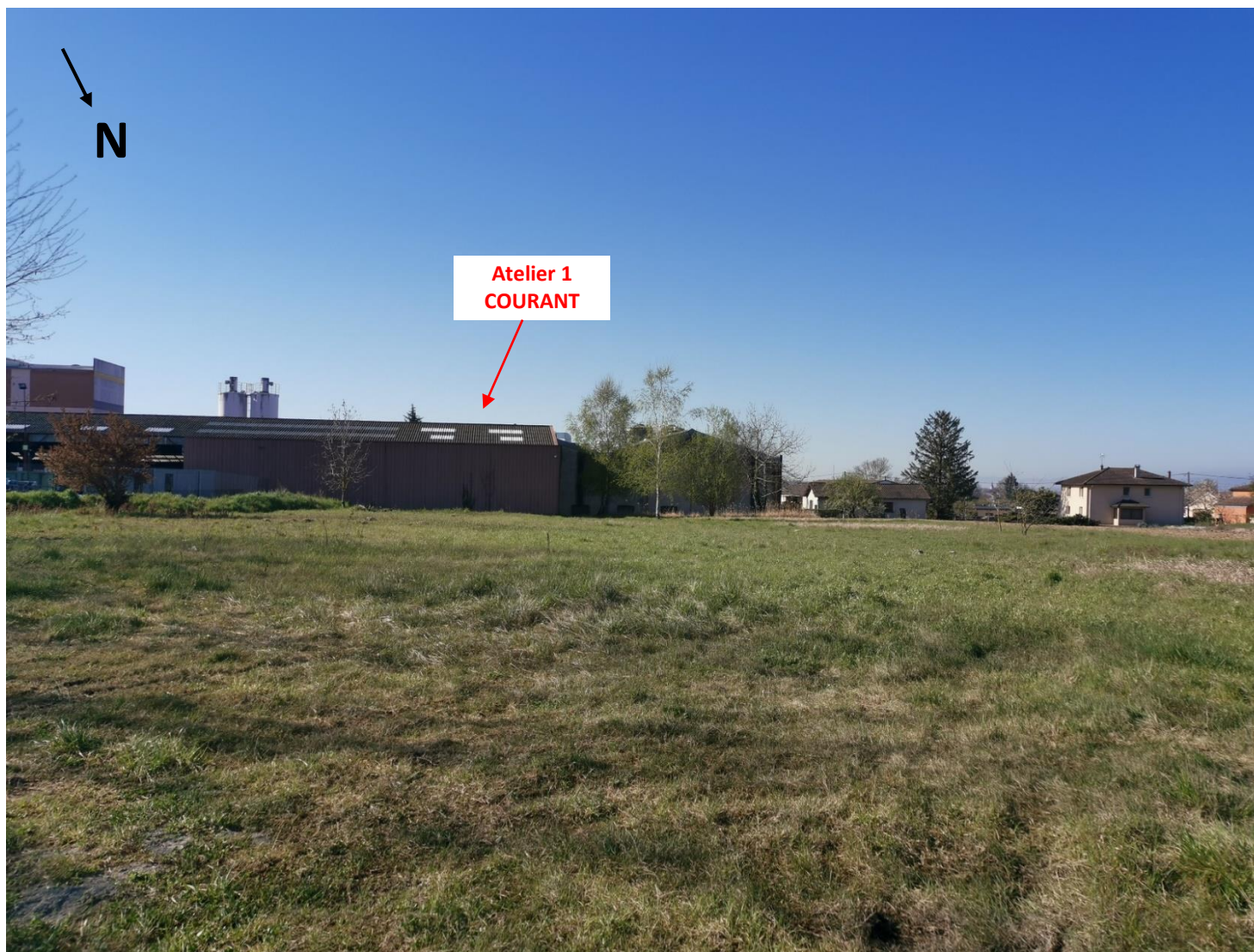
Localisation du futur emplacement de l'extension