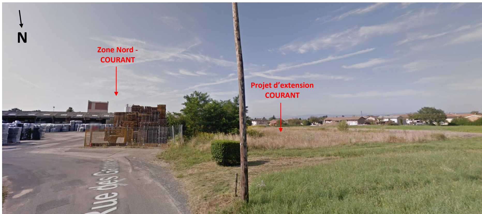
Vue du site de COURANT et son projet d'extension depuis la rue des Garines