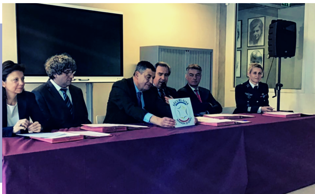
SIGNATURE DE LA CONVENTION SÉCURI-SITE - MAISON D'IZIEU - JANVIER 2019

Poursuite de la lutte contre la radicalisation par la réunion de 12 GED (groupe d'évaluation départemental), de 5 CPRAF (cellule départementale de suivi pour la prévention de la radicalisation et l'accompagnement des familles) et de deux séminaires sur la radicalisation en entreprise et dans le milieu du sport.