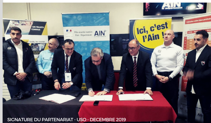
SIGNATURE DU PARTENARIAT - USO - DECEMBRE 2019