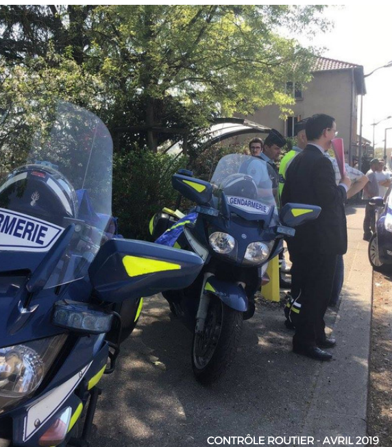
CONTRÔLE ROUTIER - AVRIL 2019