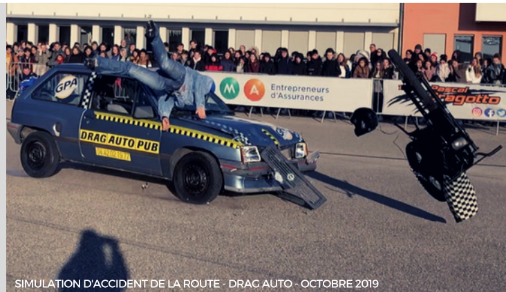
SIMULATION D'ACCIDENT DE LA ROUTE - DRAG AUTO - OCTOBRE 2019

-La signature d'un contrat de partenariat avec l'Union sportive Oyonnax rugby.