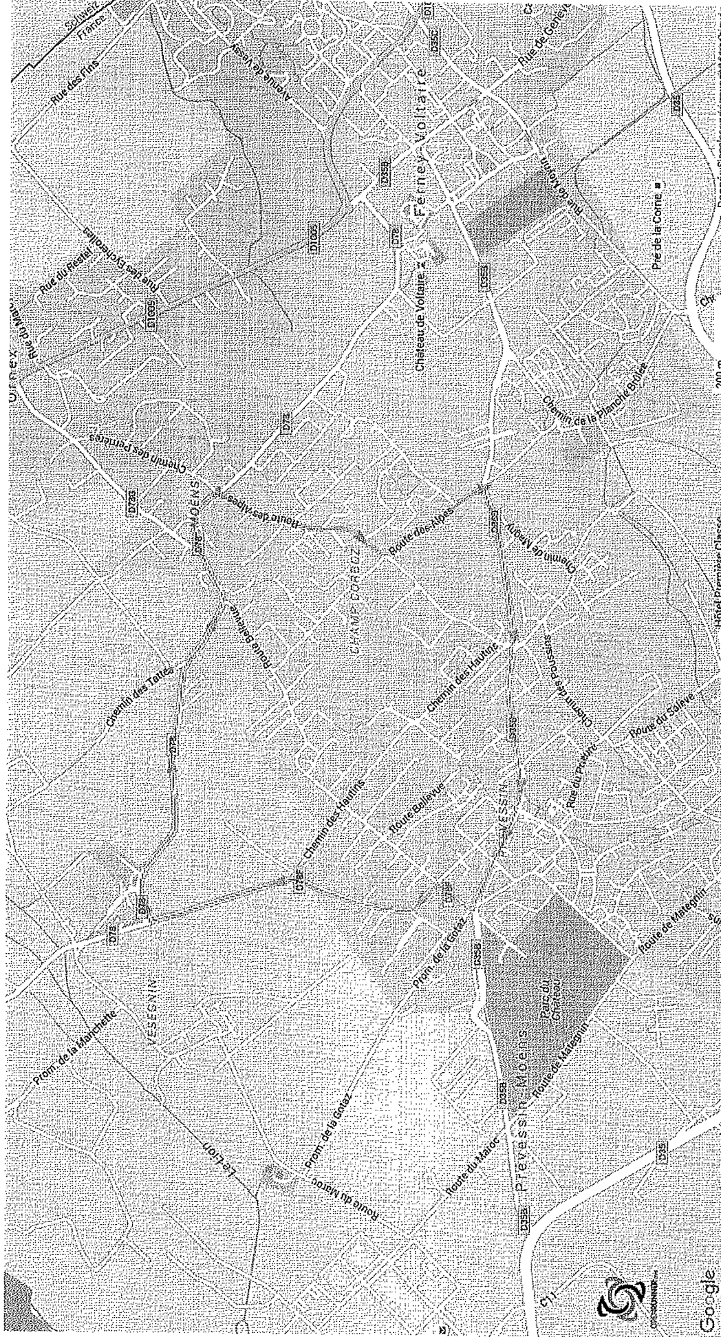
Parcours n°5554276 - tour du léman juniors - Cyclisme Route, 5.126 (km) : Préveessin-Moëns -> Préveessin-Moëns

Le droit de reproduction est strictement réservé à un usage personnel et privé. Lors de la pratique de votre activité, veillez à respecter les propriétés et chemins privés.