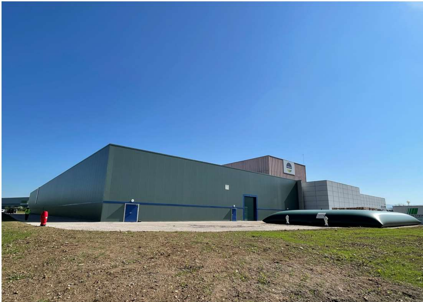
Prise de vue 5 – date : 08/04/2022