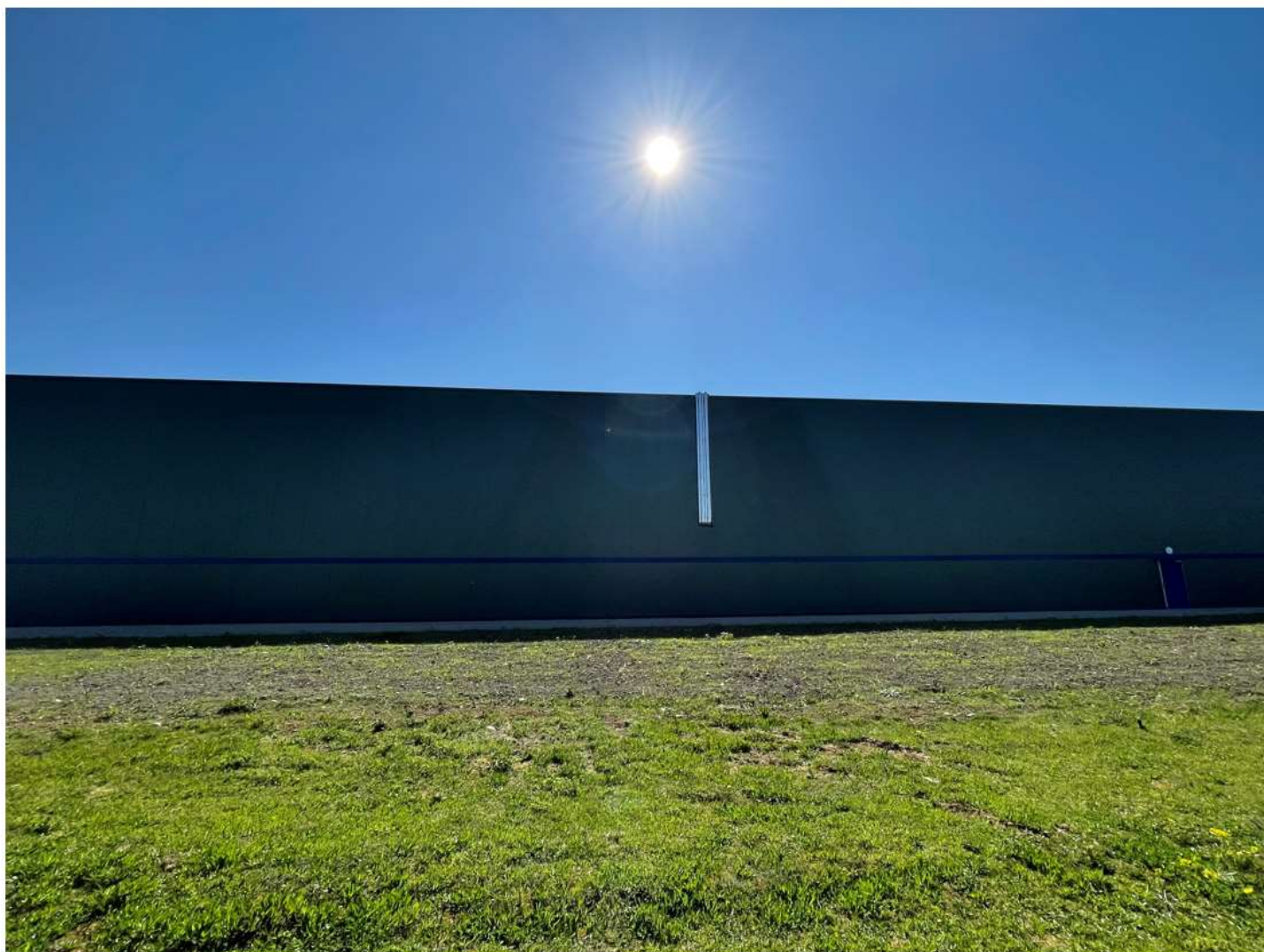
Prise de vue 2 – date : 08/04/2022