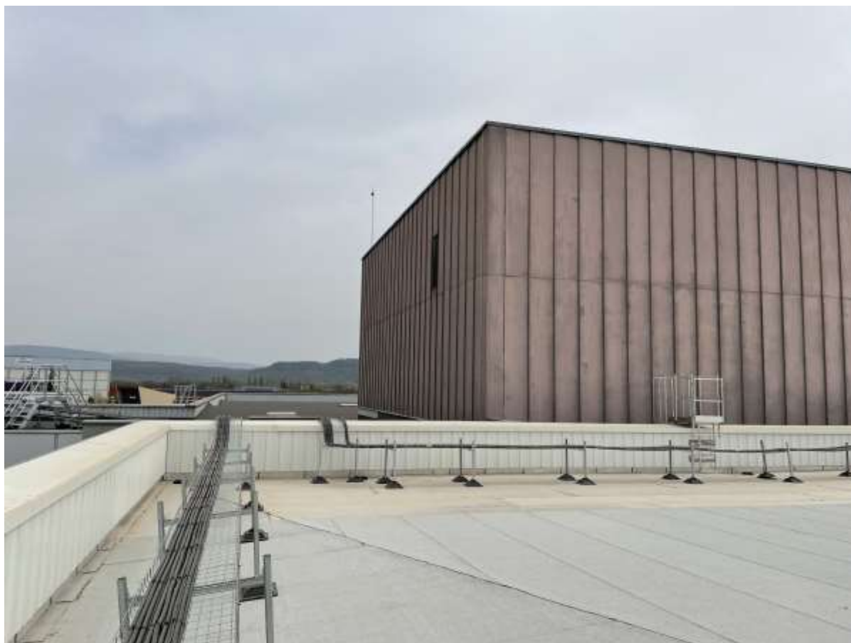
Prise de vue 1 – date : 08/04/2022