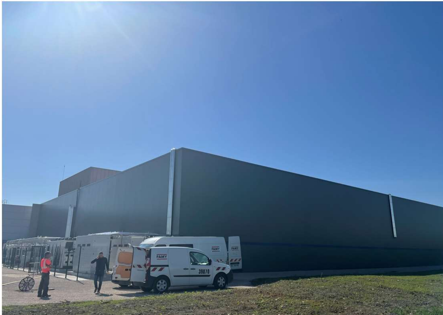
Prise de vue 6 – date : 08/04/2022