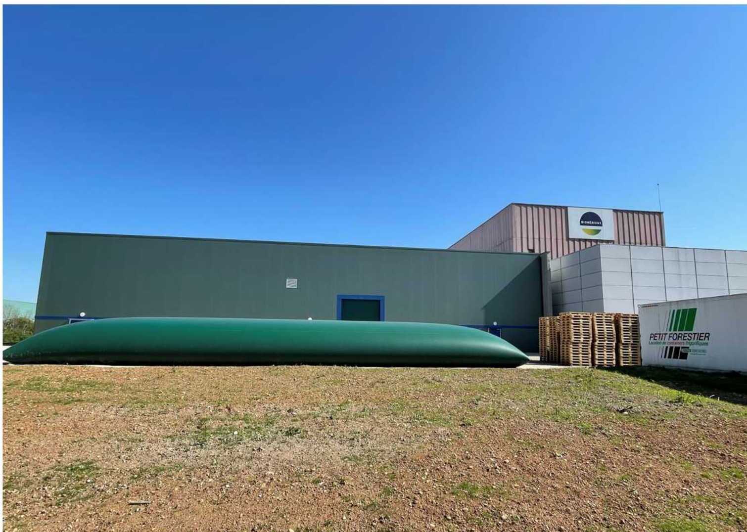
Prise de vue 3 – date : 08/04/2022