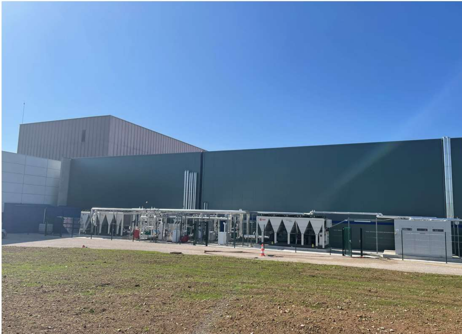
Prise de vue 4 – date : 08/04/2022