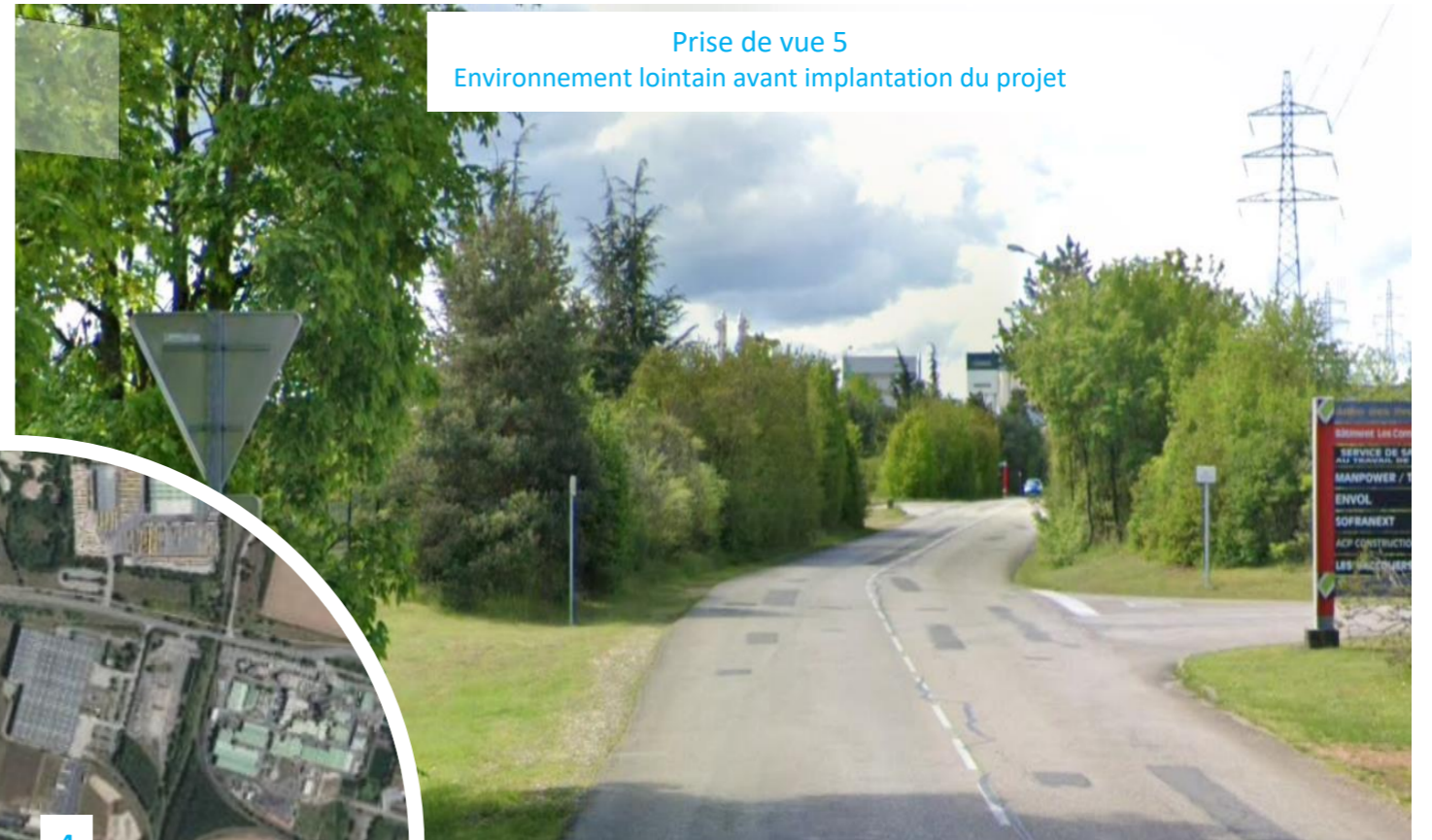
Prise de vue 5 Environnement lointain avant implantation du projet