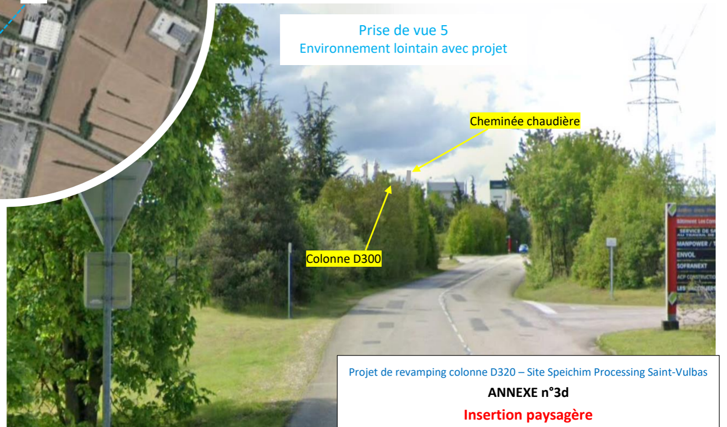
Prise de vue 5 Environnement lointain avec projet