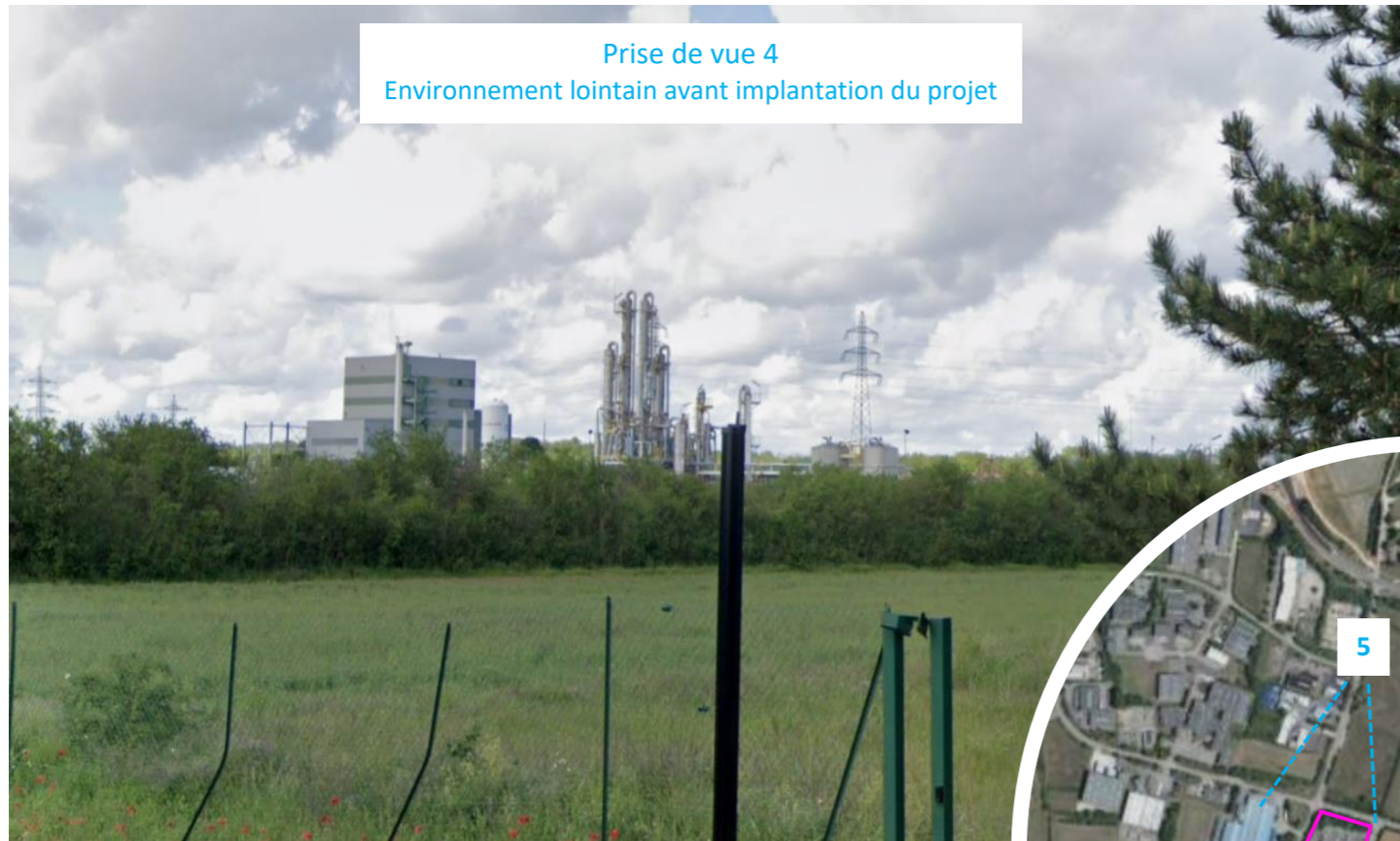
Prise de vue 4 Environnement lointain avant implantation du projet