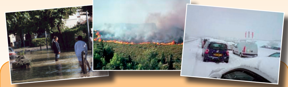
Une réponse pour faire face à ces multiples situations, LE PLAN COMMUNAL DE SAUVEGARDE :