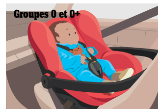
Groupes 0 et 0+

La taille et la corpulence de l'enfant imposent de l'installer dans un siège ou sur un coussin rehausseur. Il y restera jusqu'à ses 10 ans.