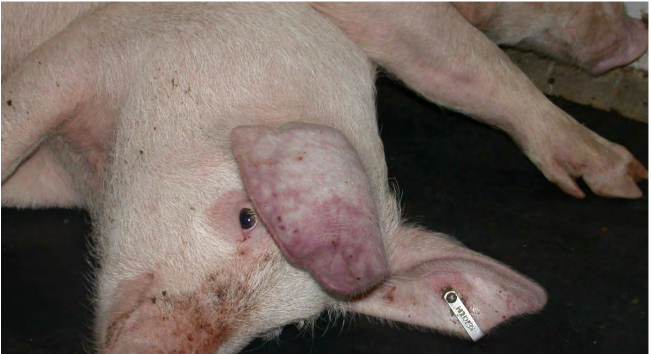
Cochons ayant contracté la PPA depuis quelques jours. Principaux symptômes : très forte température (> 41°C), attitude léthargique, perte d'appétit, rougeurs au niveau des oreilles.

L'identification de tous les interlocuteurs clé de la filière au niveau régional est conduite en parallèle (vétérinaires en activité porcine, interlocuteurs sanitaires au niveau départemental...).